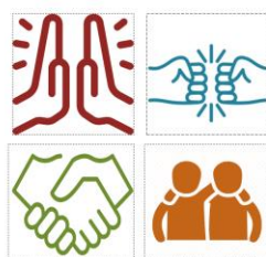
Рис. 1. Игра

Родителям предлагается взять цветную фишку. Задача будет состоять в том, чтобы поприветствовать в течение минуты как можно большее количество участников нашей встречи разными способами (в зависимости от цвета фишки) (Рисунок 1).